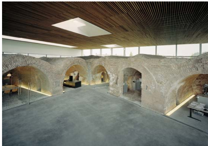
Lunet B – kantoor architectenkantoor RDH