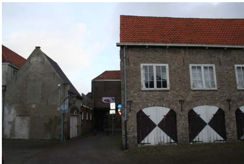
Poortcomplex gezien vanuit het Stadserf – situatie dec 2008

Stadsherstel Breda gaat panden aan het Stadserf en de St. Annastraat aankopen. Panden die een plaats verdienen op de gemeentelijke monumentenlijst. Het zijn panden die de toegang tot het Stadserf bepalen, panden in het centrum van de stad waarbij de restauratie van de panden zal uitstralen naar de St. Annastraat en het Stadserf. Om die reden is een totaalrestauratie van het poortcomplex gewenst.