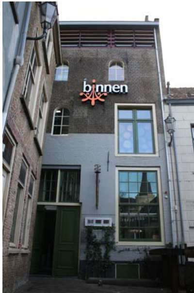
't Klapcot – na restauratie