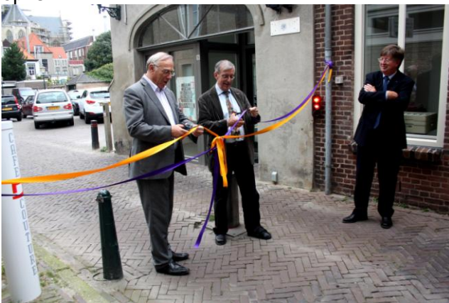
officiële opening van de panden aan de St Annastraat en Stadserf

Binnen de tijd is het gelukt een mooi restauratieproject neer te zetten waar Stadsherstel Breda trots op is.