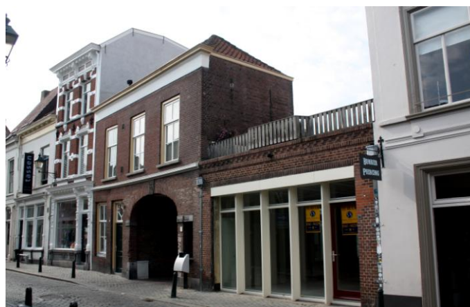
St. Annastraat 17 – 19 – 19A – 19B – 19C