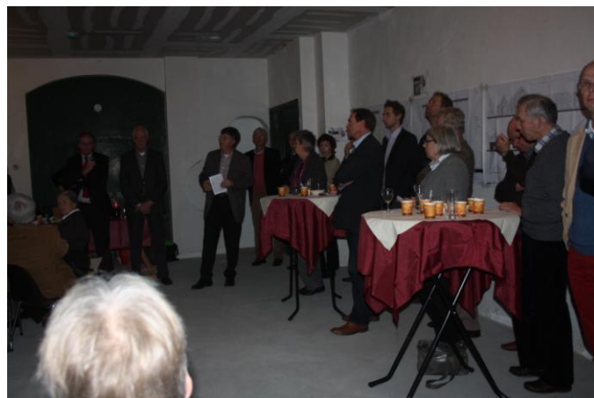
obligatiehouderbijeenkomst november 2011

Het belangrijkste is natuurlijk het resultaat. We zijn blij met de 4 mooie appartementen en 5 commerciële ruimtes. Dat de appartementen en de commerciële ruimtes in de smaak vielen blijkt wel uit het feit dat 8 van de 9 units al tijdens de bouw verhuurd waren. Alleen de commerciële ruimte Sint Annastraat 19C is nog te huur.