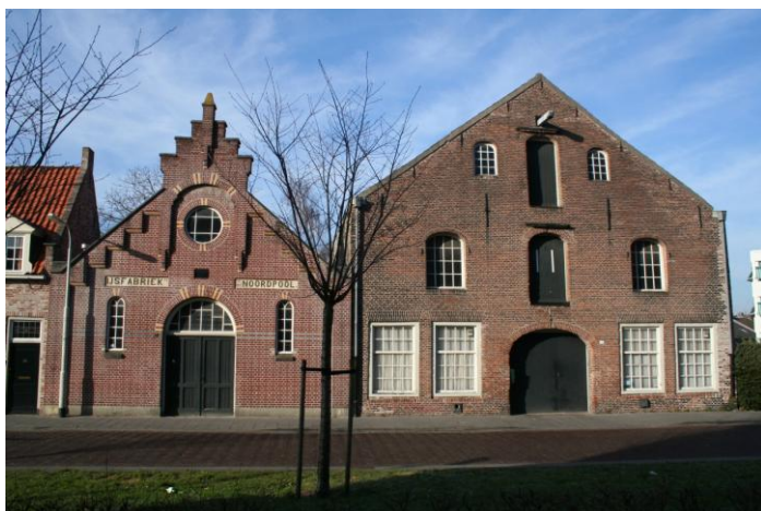
Ijsfabriek de Noordpool en Graanpakhuis de Pelmolen

Met al deze aanpassingen denken wij dat de architect erin geslaagd is een modern en strakke invulling te geven aan dit historische pand.