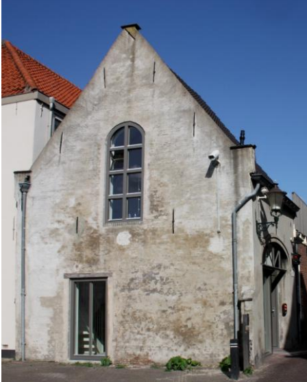
Stadserf 5 – achterzijde Annastraat 19-C

Door de verbouwing in 1971 zijn de bovenverdiepingen van 17 alleen via 19 bereikbaar.