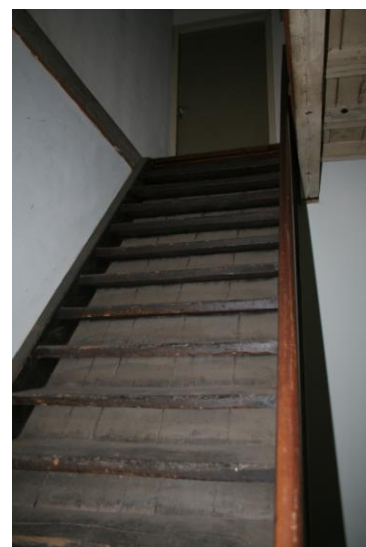
bestaande luie trap

Vanuit het gemeenschappelijk portaal wordt ook de bovenverdieping bereikt zowel met een trap als met een lift. Op de verdieping komt een grote ruimte achter met aan de voorzijde enkele spreekkamers met een glazen afscheiding, waardoor de gehele verdieping één grote ruimte lijkt. De zolder wordt maar voor een gedeelte gebruikt, aan de voorzijde en aan de achterzijde. Daartussen wordt de vloer verwijderd en komt de gehele houten kapconstructie in het zicht. Om extra licht te krijgen wordt in het centrumgebied boven in het dak een lichtstraat aangebracht zodat er naast de lichtinval door de kleinere ramen in de zijgevel er ook licht van boven komt.