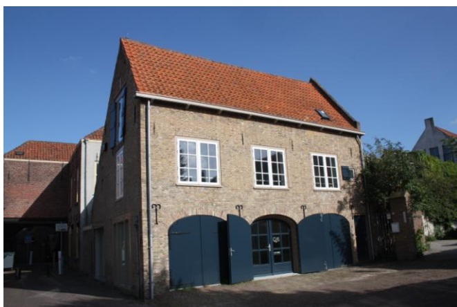
Stadserf 6 – 6A