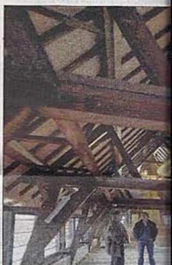
■ De gerestaureerde kap van 't