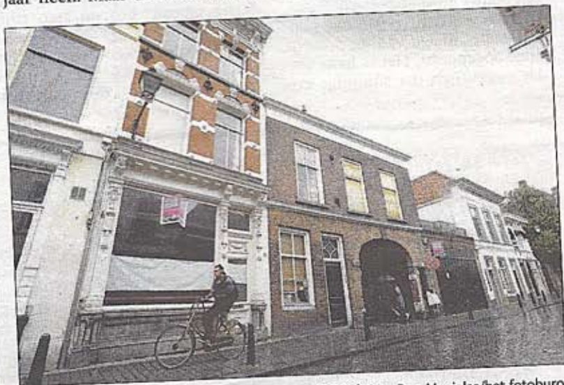
Restauratie St.-Annstraat 17, 19 en 21 (2010)