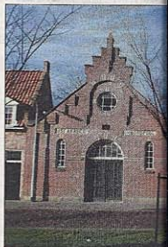
■ Eind volgende week worden