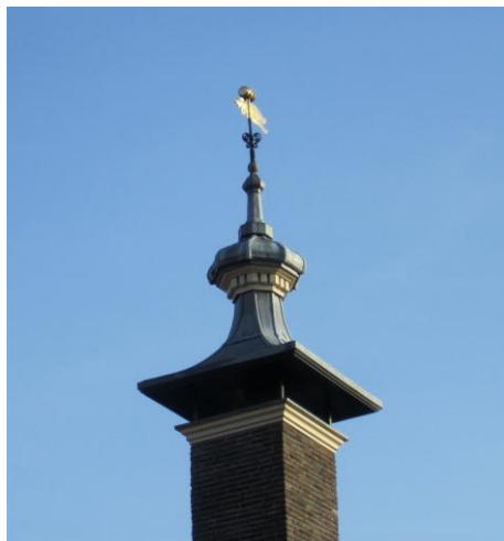
Een van de torentjes op "de Olyton" met op het windvaantje een olietonnetje.

Na een aantal jaren – in alle tevredenheid – kantoor te hebben gehouden in het gebouw van de Rabobank in Princenhage, zijn we half november 2013 met ons kantoor verhuisd naar het rijksmonument, de "De Olyton" aan de Boschstraat in Breda. Deels is dit pand verhuurd aan Compositie 5 Stedenbouw en Compositie 5 Architecten. Medio 2013 trok ook het bedrijf Strategic Board Zuid West Nederland in het pand. Met de intrek van Stadsherstel Breda is dit monument met stijkkamer meer een bedrijfsverzamelgebouw geworden.